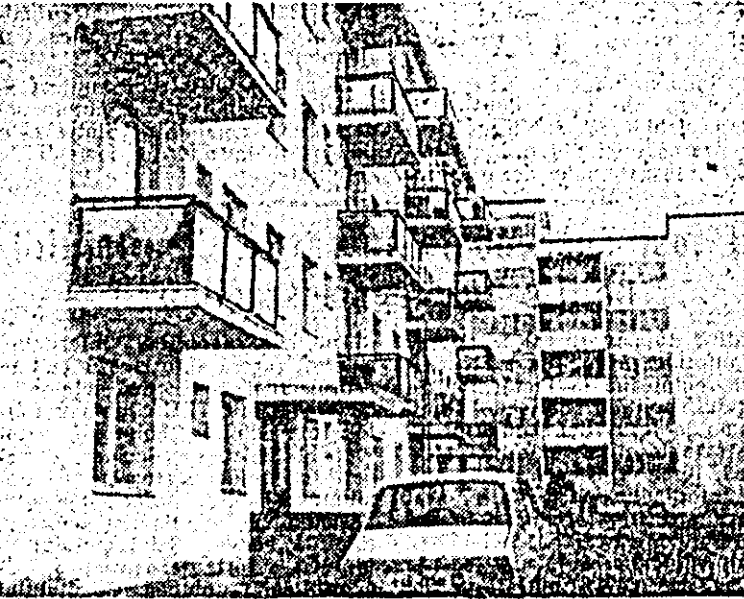
În această parte a municipiului nostru — zona gării Aradul Nou — s-au construit și dezvoltat în anii socializmului puternice unități industriale. Iată că în ultima perioadă au apărut și primele blocuri de locuințe.