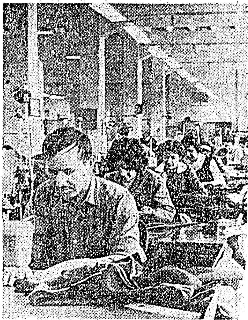
Aici, în secția a II-a a Fabricii de confecții prind „viața” noile uniforme școlare.

Harnicii cooperatorii de la „Avîntul” din Pecica nu au lăsat să se scape din mînă timpul optim, să rămînă restanțieri la semănatul culturilor din prima epocă a campaniei agricole de primăvară. Ei au mobilizat toate forțele de lucru și desfășurînd o muncă rodnică au reușit să termine de însămînțat 100 hectare cu mac, 20 hectare cu ovăz, și 125 hectare cu borșag, ceea ce înseamnă că planul la toate aceste culturi a fost îndeplinit cu succes.