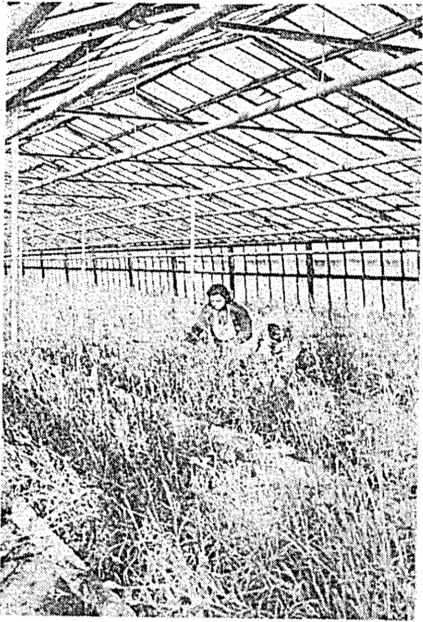
În curînd va sosi primăvara și orașul nostru va îmbrăca haina multicoloră a florilor ce-l vor împodobi parcurile, grădinițele, aleile. Pentru ca această podoabă să fie cit mai bogată și variată, în sera orașului se pregătesc pentru sezonul de primăvară peste 600.000 răsaduri de flori.