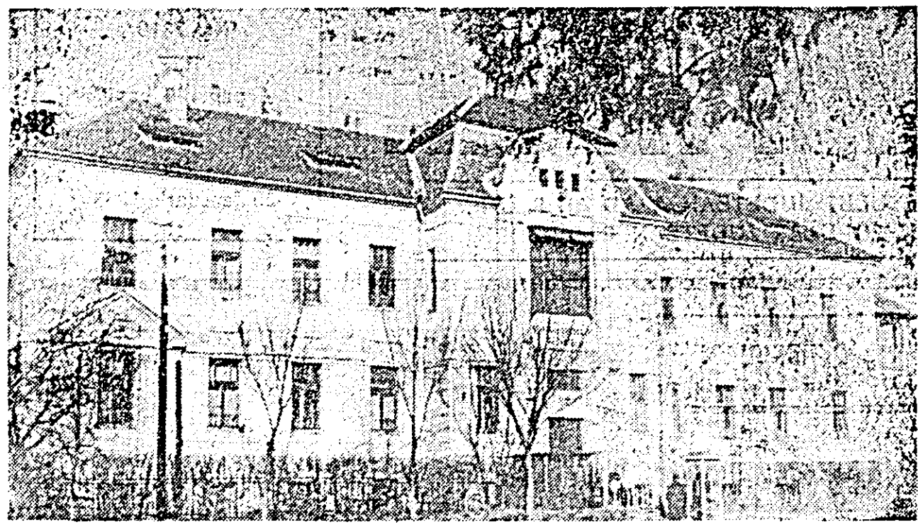
ARAD. Vedere a Spitalului de pediatrie.