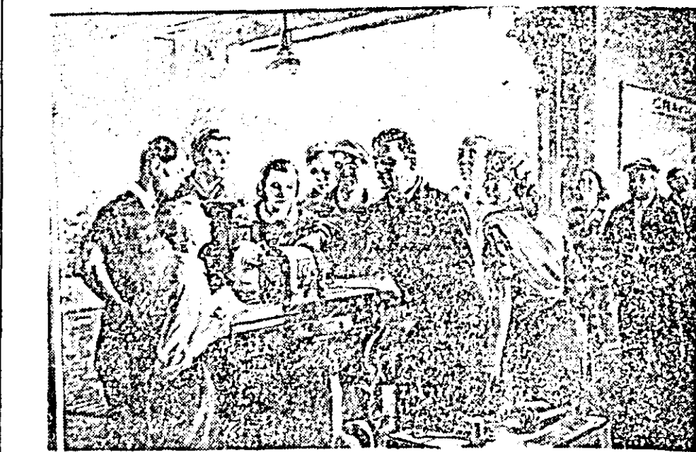
La Secția de artă a realismului socialist de la Muzeul Regional se găsesc numeroase lucrări valoroase ale artiștilor plastici contemporani. Printre acestea se află și pictura în ulei „Predarea unei metode noi a muncii”, creația a pictorului Bordi Andrei.

Aruncînd o privire generală asupra activității lor se constată că în