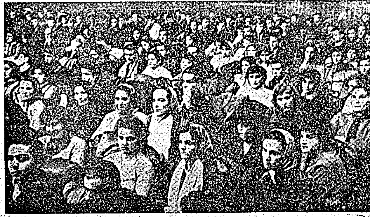
La sărbătoarea majoratului. Aspect din sala Palatului cultural.