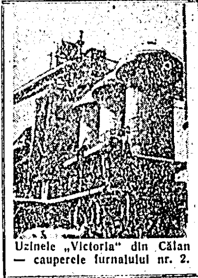
Uzinele „Victoria” din Călan — cauperele furnalului nr. 2.

În anul 1961 însemnate fonduri din planul de investiții prevăzute pentru agricultură sînt destinate dezvoltării în continuare a bazelor tehnico-materiale a agriculturii. Astfel, agricultura va primi 12.000 de tractoare, 15.000 de semănători, 6.000 de combine și alte mașini și utilaje agricole.