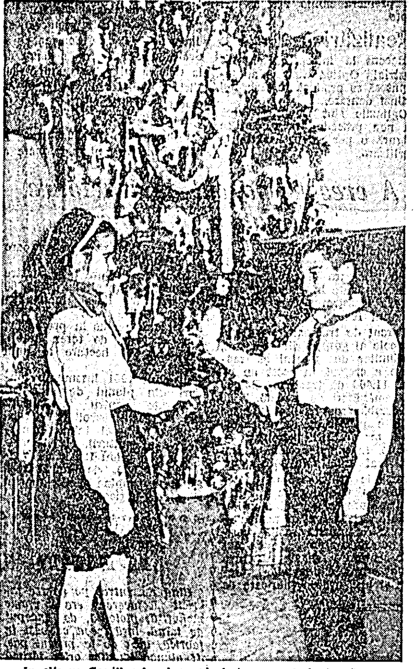
In clişeu: Copiii le place săadmire pomul de larnă.

După ce am considerat că aveam suficiente date pentru un reportaj, ne-am strecurat pe neobservate din sală, msoşii de acordurile unui tangou. I. Şt.