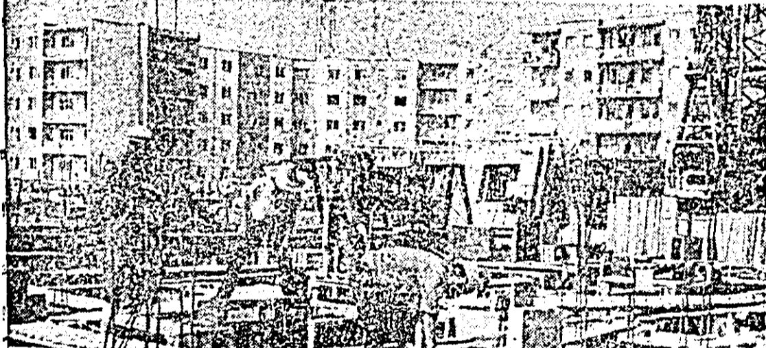
Iată una dintre imaginile care pot fi întâlnite peste tot în municipiul nostru: constructorii înălță noi și noi blocuri de locuințe, mărturie elocventă a transunerii în viață a politicii partidului de ridicare continuă a bunăstării poporului.