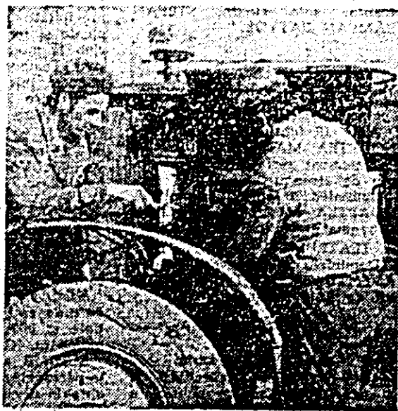
La secția de mecanizare de la Lermăia Neagră se execută ultimele reparații la utilajul agricol.