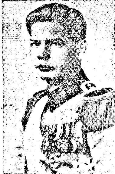
ÖFELSÉGE II. CAROL KIRÁLY ÖFENSÉGE MIHAI NAGYVAJDA

lyek már nincsenek, örködtött egy állandó valami, aminek fényéből osztozott a történelem, egy állandó valami, amely az ivet a jobb eljövendő, a fejlődés felé vitte: a korona.