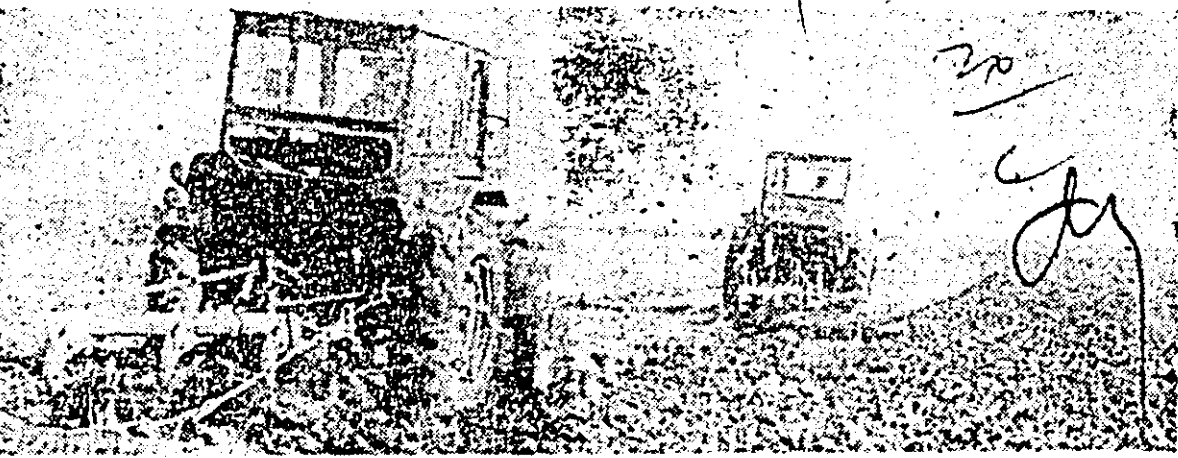
Aspect de la executarea arăturilor de toamnă pe ogoarele cooperativei agricole de producție din Frumușeni.