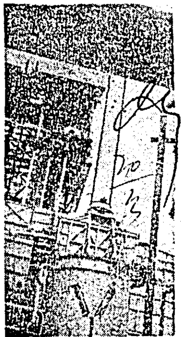
Un fragment din frumoasa geografe pe care o finalizează în aceste zile constructorii și montorii Combinatului chimic arădean.