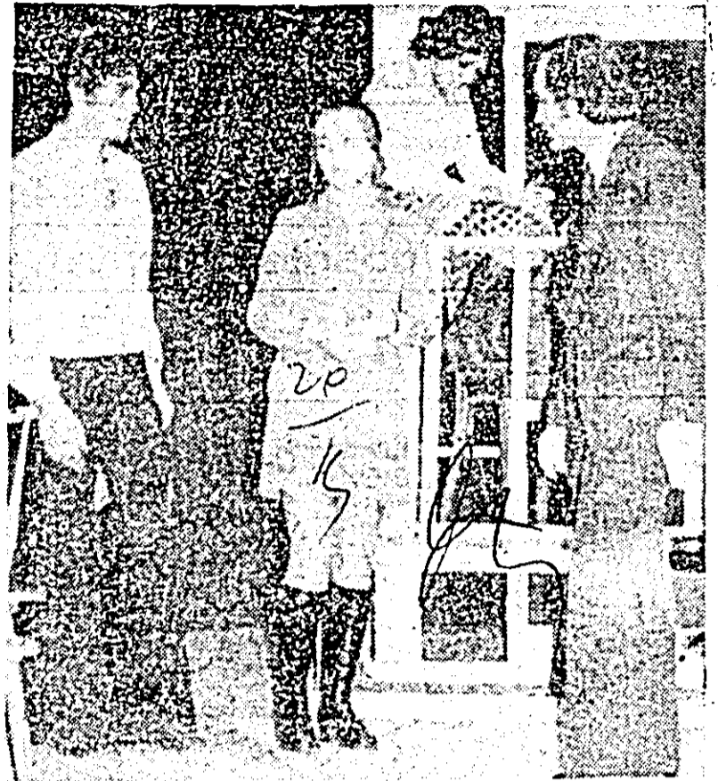
„O împlinire la sectorul suflet” de Al. Mirodan în interpretarea formației de la Cooperativa meșteșugărească „Artex”.

REDACȚIA: Programul elaborat de conducerea partidului prefigurează „în scopul stimulării creației și interpretării artistice în rîndul maselor” organizarea într-un sistem unitar a Festivalului național al educației și culturii socialiste „Cîntarea României”. Este un cadru nou și foarte propice pentru afirmarea artei interpretative de amatori și mai ales pentru ridicarea calității manifestărilor,