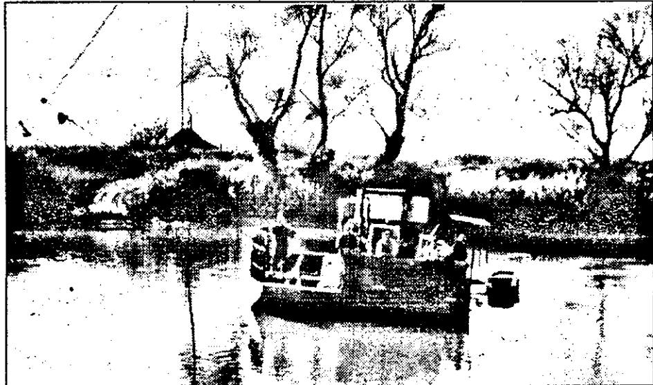
În această toamnă brodul de la Conop a fost mult mai solicitat decât în alți ani... În imagine este trecut de pe un mal pe altul un tractor cu o remorcă plină cu porumb.