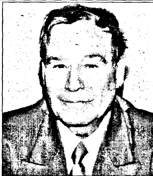
- Care este părerea dumneavoastră despre asociațiile agricole?

- V-am spus la început că părinții mei au fost țărani. Eu nu am uitat de unde am plecat. În deplasările făcute în județ, nu doar în campania electorală, am putut constata pe viu starea deplorabilă în care se găsește agricultura românească. În primul rând este vorba de lipsa mașinilor și uneltelor agricole. De aceea, voi lupta pentru ca țăranilor să li se acorde credite pe termen lung, dar cu dobânzi mici, pentru a-și putea asigura mașinile și uneltelile necesare. De ce spun asta? Pentru că țăranilor li s-a pus în brațe pământul, dar aceiași brațe, singure, n-aveau cum să-l slujească. Nu poate exista o agricultură modernă, competitivă în care se lucrează cu brațele.