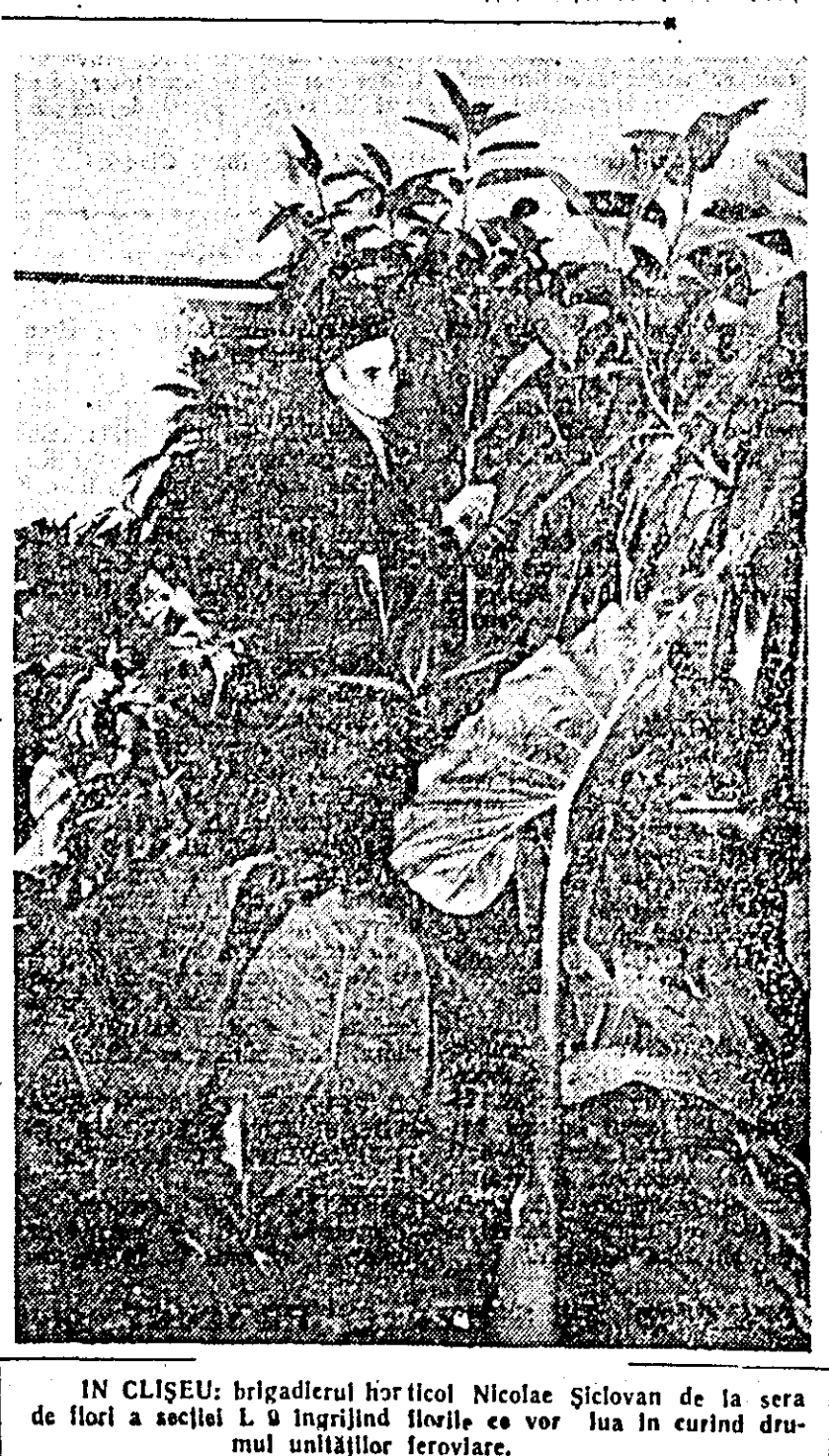
IN CLIȘEU: brigădierul horticol Nicolae Sclavan de la sera de flori a secției L.9 îngrijind florile ce vor lua în curînd drumul unităților feroviare.