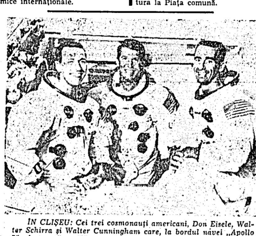
IN CLISEU: Cei trei cosmonauți americani, Don Eisele, Walter Schirra și Walter Cunningham care, la bordul navei „Apollo 7” efectuează o călătorie de 11 zile în spațiul cosmic.

prin care se reglementează situația cetățenilor iugoslavi angajați în Republica federală, ca și problema asigurării sociale și medicale în cazul lipsei de lucru a acestora.