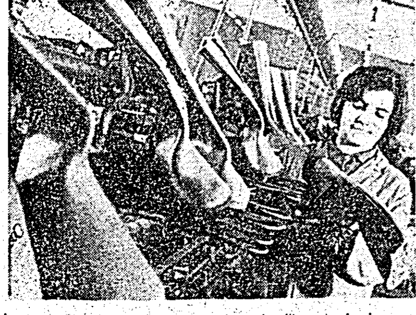
Fabrica Libertatea. Lînia de confecționat cizmulețe pentru femei.