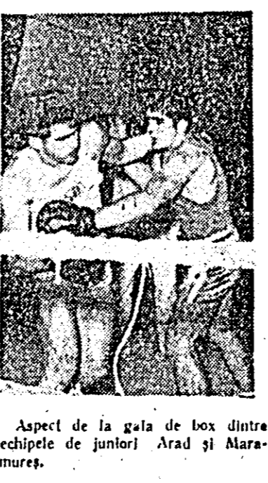
Aspect de la gala de box dintre echipele de juniori Arad și Alaramureș.

► Zilele filmului românesc la Alger Pagina a IV-a