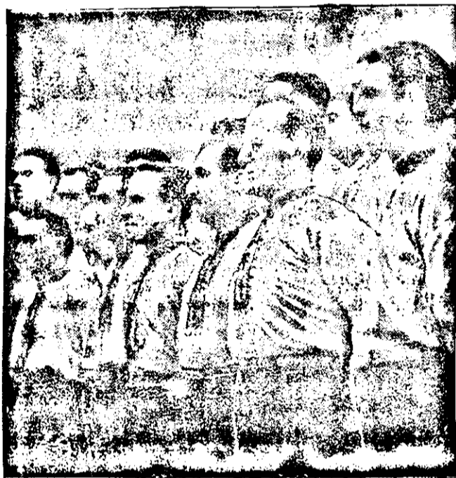
Ein bulgarischer Volksschor konzertiert in Deutschland

Die weiteren wichtigsten Einfuhrartikel waren Papier und Papierwaren, Rautschul und Gummierzeugnisse, Zelluloid u. a., optische Instrumente und Glaswaren.