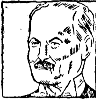
Albert Lebrun der französische Staatspräsident hat die Abdankung der Daladier-Regierung zur Kenntnis genommen.