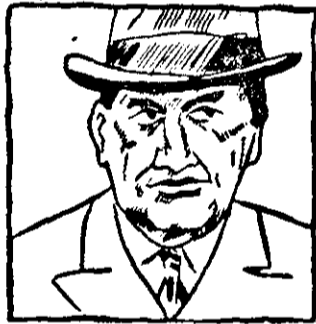
Daladier der gestürzte franz. Ministerpräsident ist Kriegsminister im jetzigen Reynaud-Kabinett.

ALEXANDER ANGERER Herrenschnneider, Arab, verfertigt die elegantesten HERRENANZÜGE nach neuester Mode, zu kulantem Preisen.