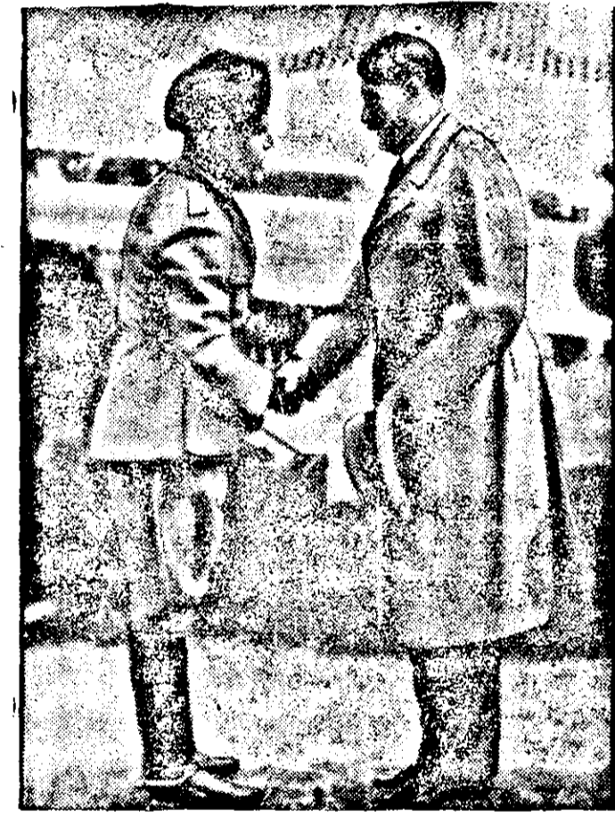
Zusammentunft der zwei bedeutendsten Männer Europas.

Berlin. Reichsorganisationsleiter Dr. Ley wird am Ostersonntag um 20 Uhr nach unserer Zeitrechnung im Radio sprechen. Seine Rede wird durch alle Reichssender übermittelt werden.