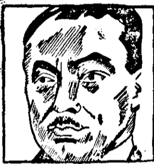
Paul Reynaud der neue französische Ministerpräsident, hat seine Regierung zusammengestellt.