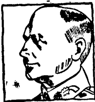
Generaloberst von Brauchitsch der Oberbefehlshaber des Deutschen Heeres beging gestern seinen 40. Tag des Eintrittes in die Armee.

In Bukarest steigen Sie nur in den Hotels