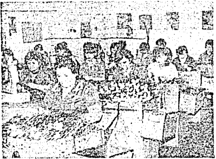
Aspect de muncă la întreprinderea de bunuri metale Arad.