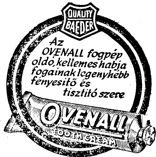
A HABZÓ FOGPÉP