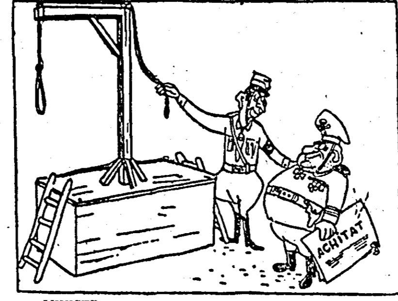
MINISTRUL DE INTERNE DE LA BONN, SCHRODER: — TE FELICIT, GENERALE! DE OAMENI CA DUMNEATA AVEM NEVOIE LA ACEST CAPAT AL FRINGHIEI! Desen de Ailsch (din „Berliner Zeitung am Abend”).

Agencia ADN reproduce declarația unui purtător de cuvînt al Ministerului de Război al R.F. Germane care a afirmat că în Germania occidentală „trupele Bundeswehrului și ale aliaților nu au spațiu suficient pentru manevre”. În legătură cu aceasta în știri se arată că numai în 1956 în Germania occidentală s-au confiscat în scopuri militare 185.000 ha. în 1957—1958 — peste 114.000 ha, iar în 1959