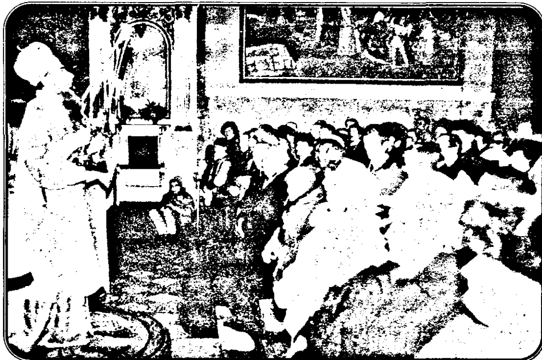
La Sfânta Liturghie de Crăciun prin pastoraia rostită de P.S. Timotei, Episcop al Aradului, credincioșii au trăit sărbătoarea Nașterii lui Iisus Hristos.