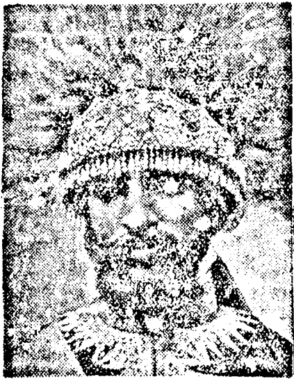
RAS TAFARI Abesszinia császára

Bucurestiből jelentik: Az egyik fővárosi lap érdekes cikket közöl egyik Abessziniában időző munkatársa tollából. Az újságíró, aki nemrégiben csinált interjút Ras Tafari csá-