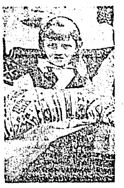
Portul popular de la Rădești a fost și rămîne frumos. rale prin tehnica fesăturii, alesu- rii, cusăturii și împletitului de ed- tre fardacile din acest sat nu se reduc numai la caracterul de ob- iecte utile, ci reprezintă o valo- re artistică, așa după cum se ob- servă și în ilustrația alăturată. Portul popular de la Rădești a fost și rămîne frumos.