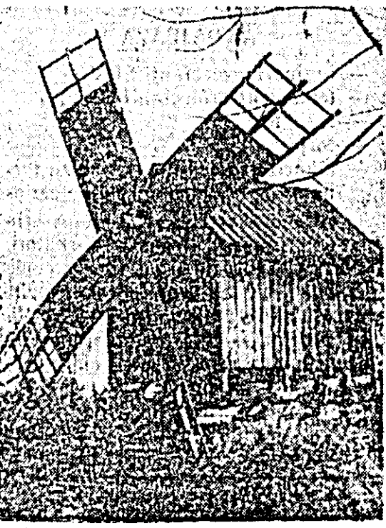
Imagine de la Muzeul satului — București.