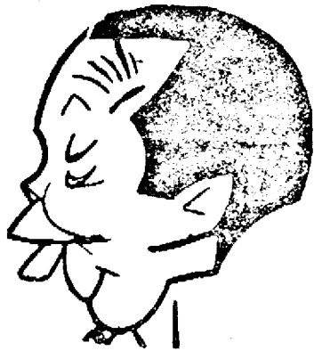
D. N. TITULESCU ministrul nostru la Londra

Conferința inaugurală a făcut-o dl Titulescu Joi, tratând despre politică și știință. D. Titulescu