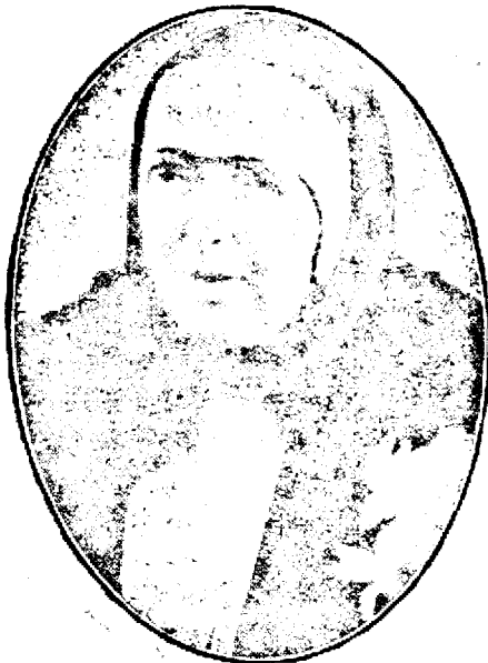
M. S. Regina Maria

„În multe manifestații și discursuri ce au alcătuit marea comemorație dela Alba-Iulia, care a mișcat adânc și durabil inimile a sute de mii de țărani, mi s'a părut că în fixarea meritelor a lipsit o subliniere, una puternică și solemnă.