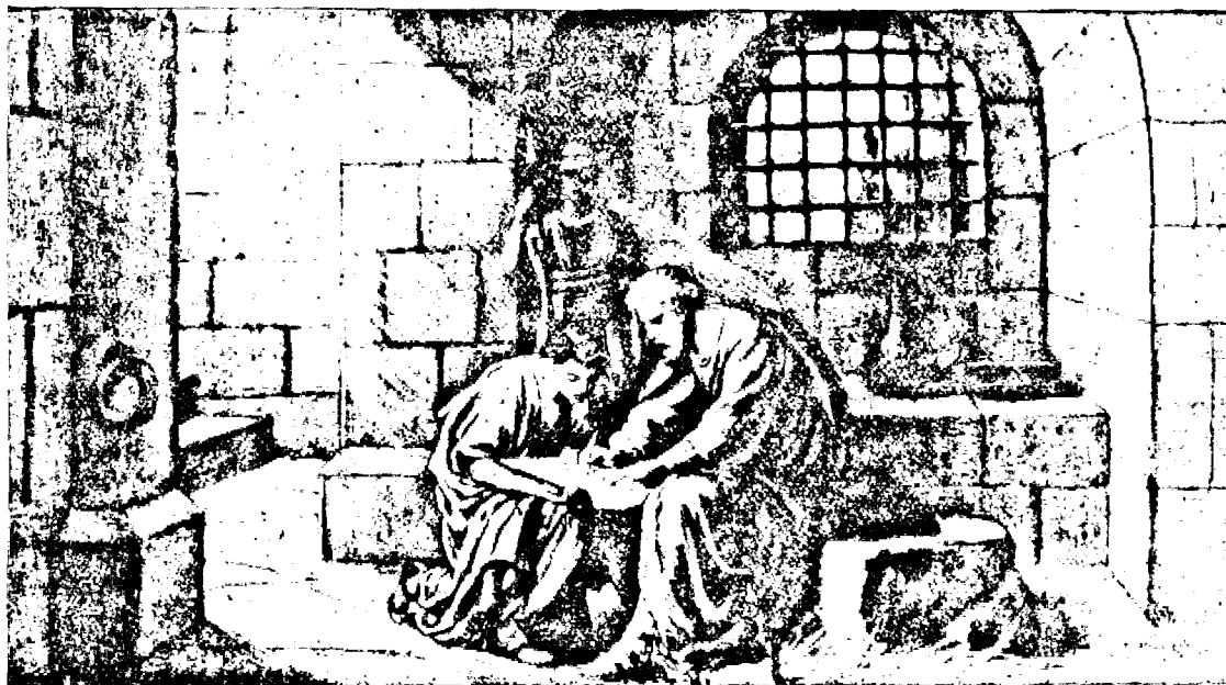
Pavel în temniță, scriind epistole

cească și cetățenia romană l-au ajutat să ajungă un apostol minunat printre neamurile păgâne. Indată după pocăință, Saul pleacă în Arabia unde petrece vreo trei ani, după care se reîntoarce acasă, în Tars, unde rămâne încă vreo cinci sau șase ani de zile. Din Tars, la invitația lui Barnaba, Saul se mută în Antiohia, unde predică un an întreg. Când a sosit în Antiohia, a fost probabil la vârsta de 40 de ani. În urma lucrării desfășurate de Saul, Antiohia ajunge un mare centru misionar. De aici pleacă misionarii creștini pentru a evangheliza și