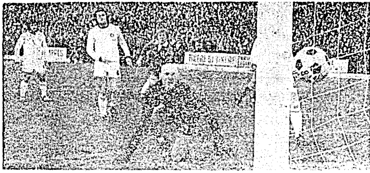
Minutul 6: după ce mingea revine în teren din bară, Leac, (în centrul imaginii) trimite în plasă. Golul nu a fost validat pe motiv de „faul la portar”. Din imaginea de mai sus, nu rezultă așa ceva.