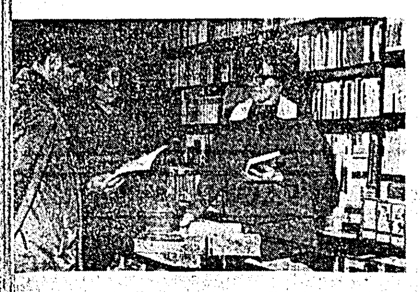
Au scos cărți noi