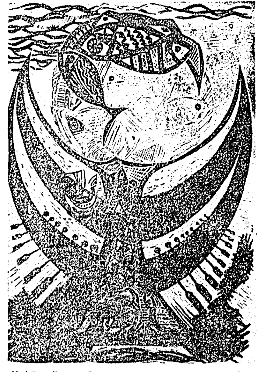
Marină — linogravură, LIA COTT