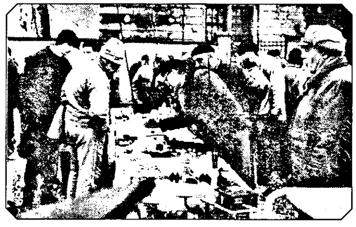
Chiar dacă plouă mărunț, cei pasionați de creșterea păsărilor și a animalelor mici nu pot lipsi de la piață...

mane. După cum am spus, prețul acestora diferă, în afară de rasă și vârstă, și funcție de... identitatea animalului (dacă animalul are sau nu acte de identitate). „Dacă n-aș avea acte, l-aș da cu cel puțin 100 de mărci mai puțin, dar așa țin și eu puțin la preț” - ne-a mărturisit un crescător „de profesie”.