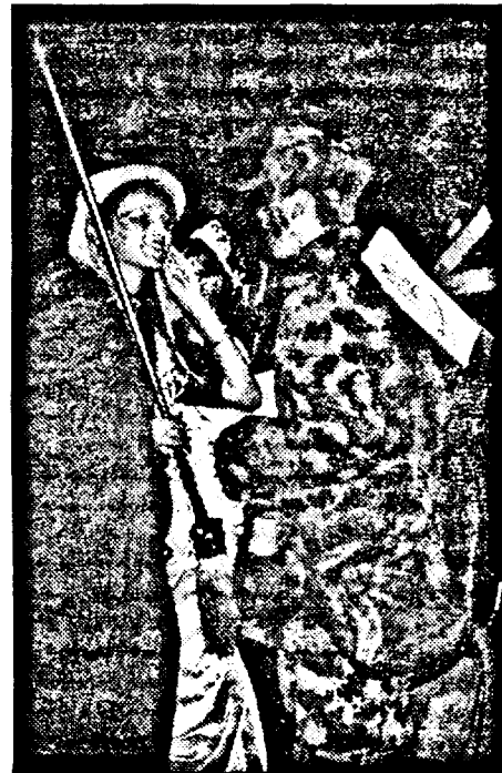
MONICA ARDELEAN

Pe la ora 1 a început să se destrame distracția; ultimii supraviețuitori au plecat la orele 3,00. După ce au mai cântat în parc 3-4 piese la chitară, au luat-o spre taxiuri plini de frig și tăbărâți de oboseală. Noroc că a urmat un weekend.