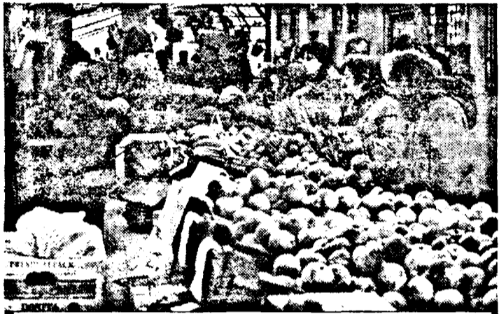
Mesele de la „Fortuna” sunt supraaglomerate, în orice oră din zi