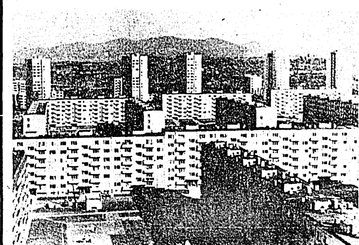
R. P. BULGARIA — Noul complex de locuințe Motopist din Sofia; el cuprinde 10.000 de apartamente.

MIERCURI DIMINEAȚA, în orașul argentinian Cordoba a fost declarată o grevă generală în semn de solidaritate cu feroviarilor greviști din Rosario. Potrivit unui comunicat guvernamental, la Cordoba au fost suspendate toate activitățile publice. În cursul incidentului au fost marșuri între greviștii din Rosario și poliție, au fost răniți poliștii. Numărul de demonstrații zilnice nu a fost încă stabilit.