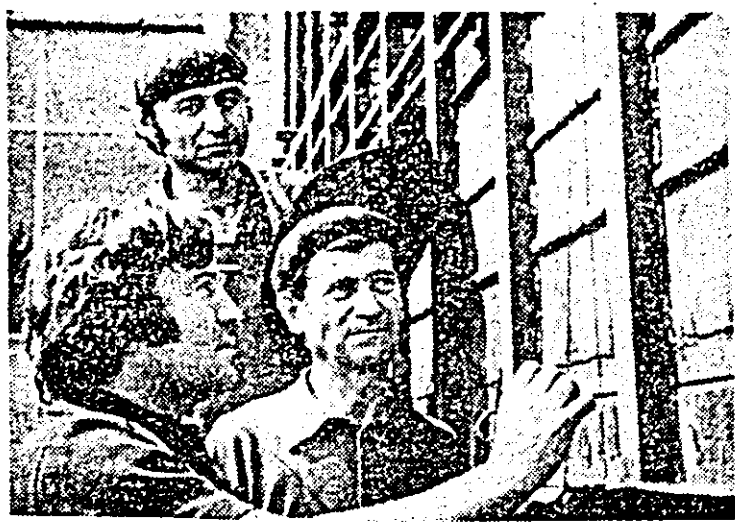
I.M.A.I.A. Se lucrează la un nou produs: autotren pentru transportat oi.