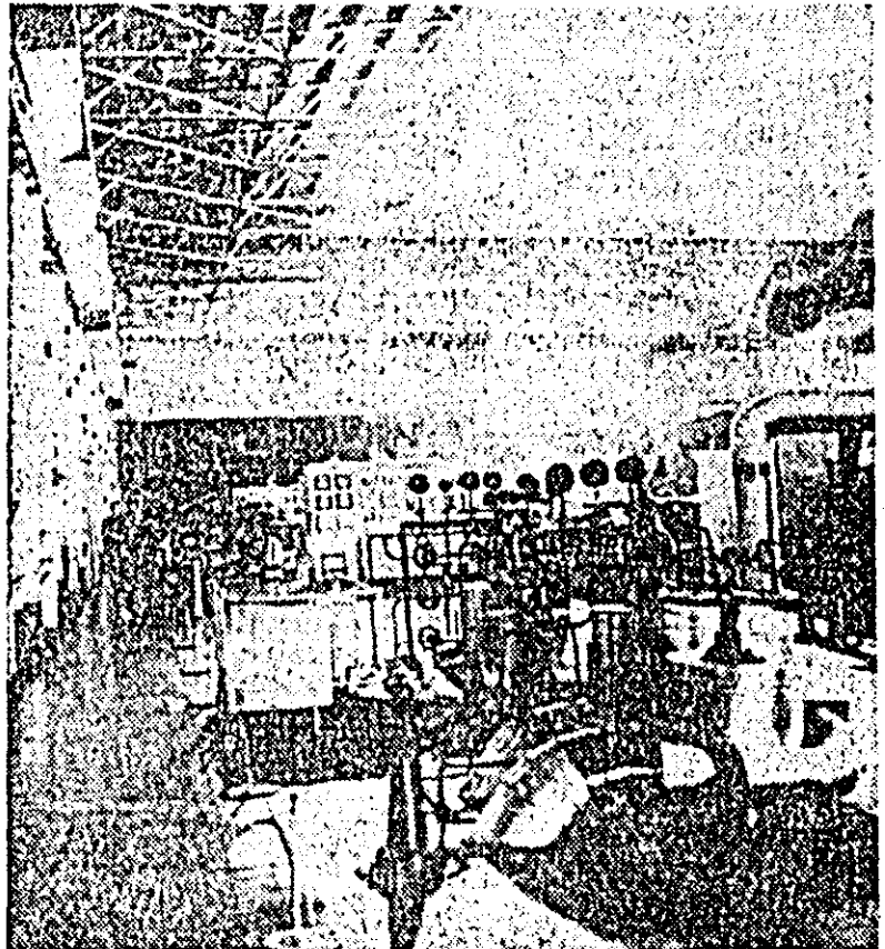
U.R.S.S. — Construcția centralei electrice atomice de la Novo-Voronej continuă în ritm susținut. Primul obiectiv agregat cu o putere de 210 MW a furnizat în anul 1967 un miliard trei sute milioane kw-ore de energie electrică. In anul 1968 această cifră va ajunge la un miliard și jumătate. Acum la centrală se montează al doilea agregat cu o putere de 365 MW și va fi dat în funcțiune spre sfîrșitul anului 1968.

România, consecventă principiilor pe care le promovează în politica sa externă, este gata să aducă în continuare contribuția la schimburile internaționale de valori materiale și spirituale, pe cale bilaterală sau multilaterală, inclusiv prin intermediul organizațiilor internaționale.