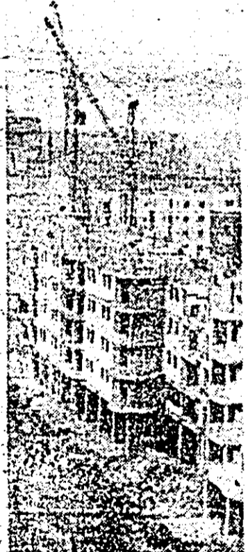
Arad, în construcție, noi blocuri de locuințe.