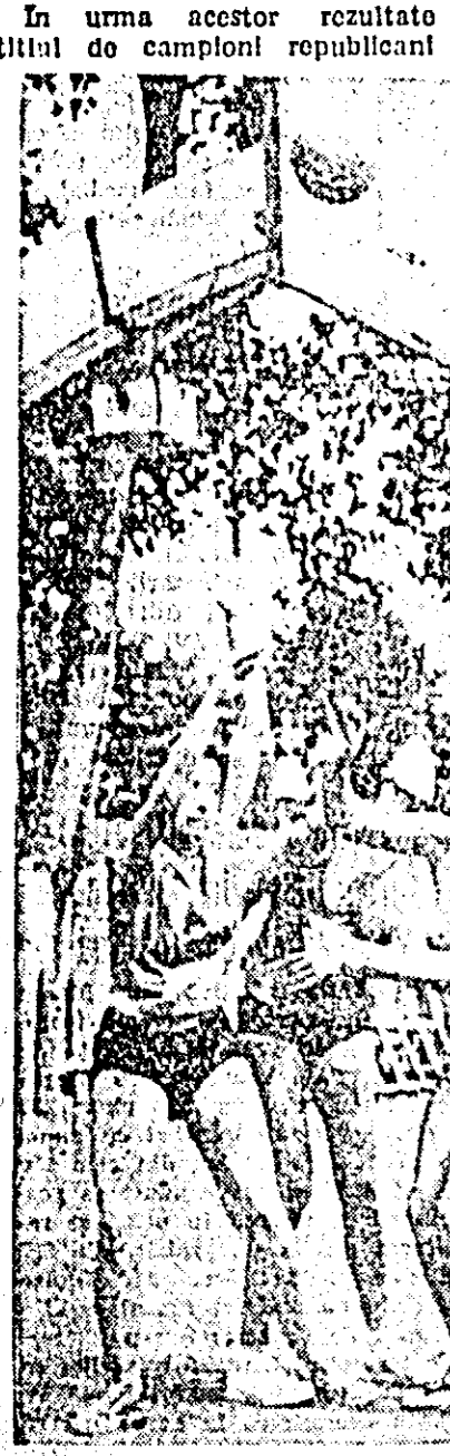
Fază de la finalele campionatului republican de baschet al școlilor sportive de elevi.

Finala (la băieți) a fost una din cele mai frumoase partide, ambele echipe (București-Ploiești) fiind bine pregătite, posedind o serie de jucători talentați.