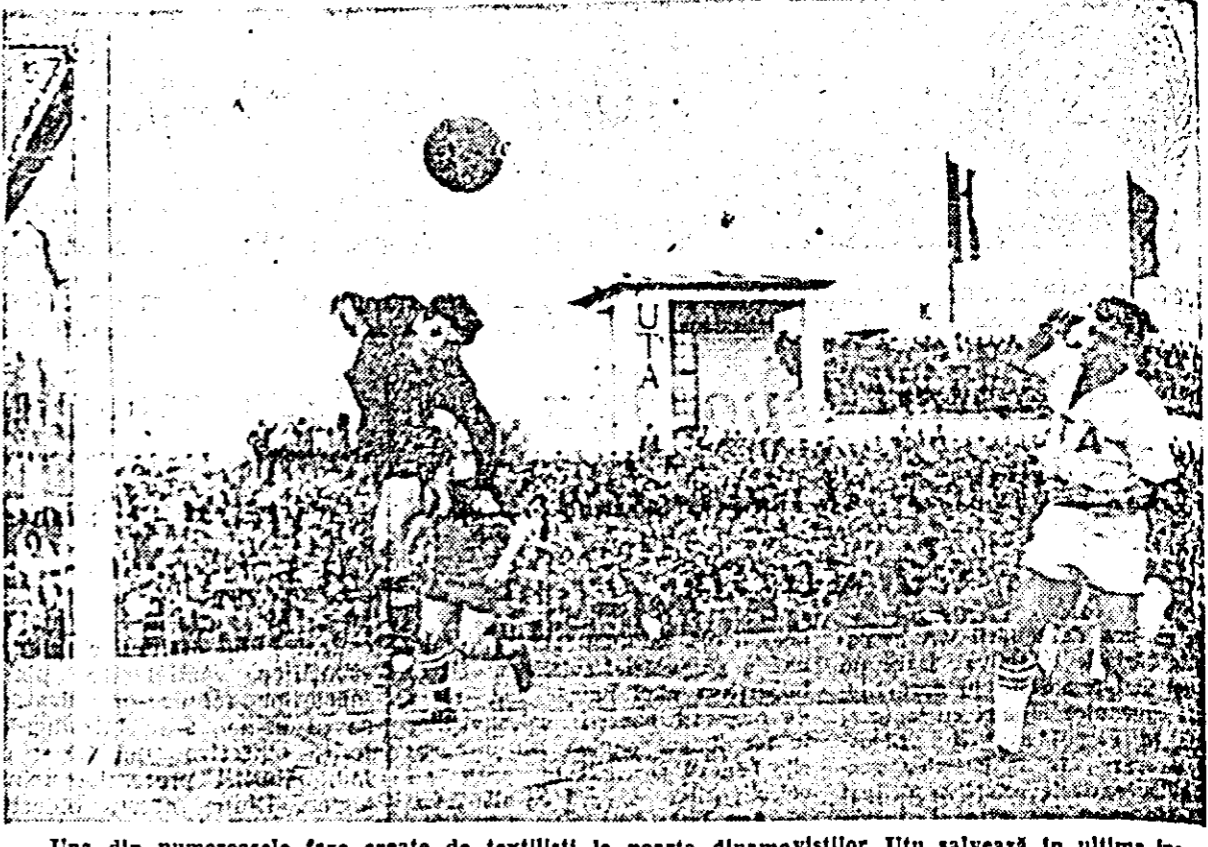
Una din numeroasele faze create de textiliștii la poarta dinamoviștilor. Uju salvează în ultima instanță în fața lui Czakó.