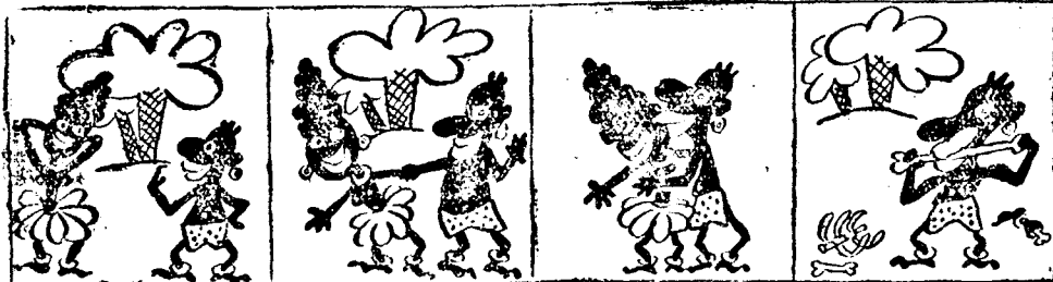
avagy: hogyan értelmezi egy tüzes néger szeladon az „Ugy szeretlek, majd megesszlek” kezdetű hallgató-nótát...2.

TENNISZEZŐK! Legnagyobb választék ütőkben, olpökben és összes sportfelszerelési cikkekben SPORT - CENTRAL, Str. Moise Nicoara 2. Teljes hurozás géppel részurozás.