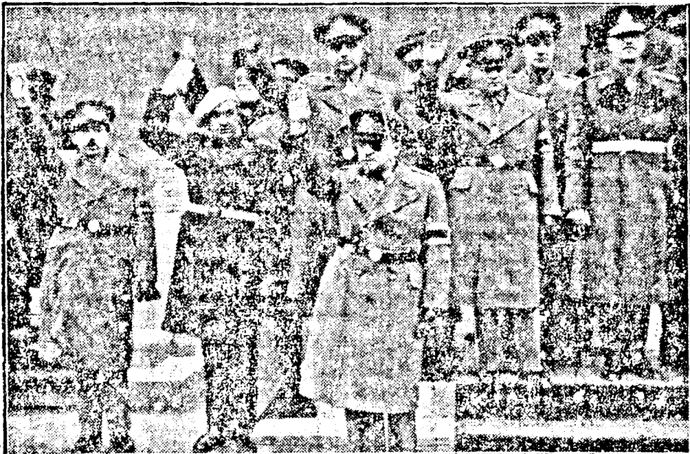
a kormány tagjaival a Nemzeti Ujjászűtés Frontjának új formaruhájában.