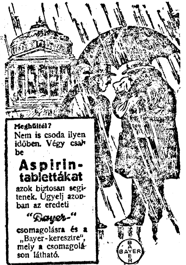
Az Aspirin-tabletták egyedülállóak az egész világon

* Az aradi színházi iroda hírek. Páratlan siker jegyében zajlott le a Pók premierje, amely az első igaz nagy prózaújdonsága volt az aradi színháznak. A közönség mindvégig a legnagyobb idegességekben kapcsolódott be a darab menetébe,