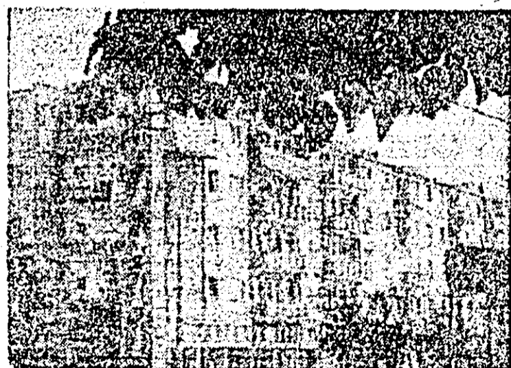
Blocuri noi în orașul Nădlac.