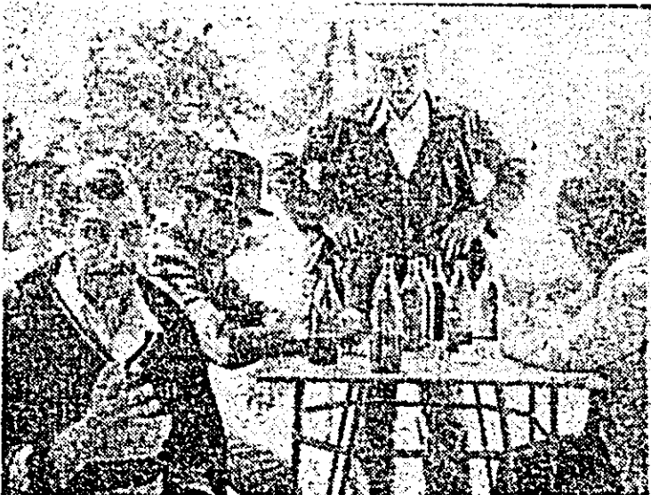
În grădina de vară a restaurantului din Covsint, „contractanții” se răcoresc cu bere. Și asta ziua-n amiaza mare cînd ar fi trebuit să sape culturile prășitoare la C.A.P.