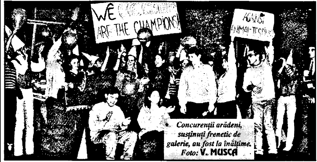
Concurenții arădeni, susținuți frenetic de galerie, au fost la înălțime.