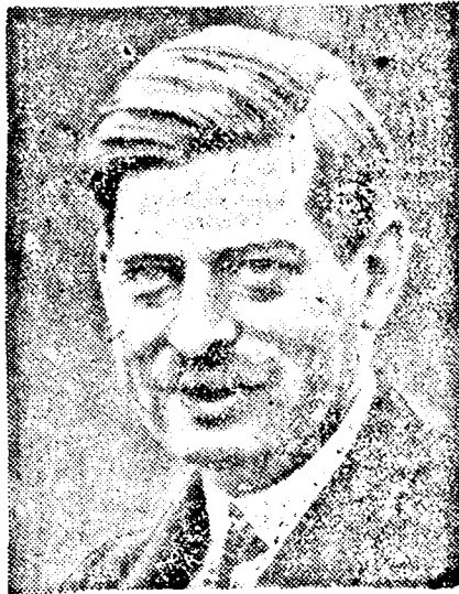
II. CAROL KIRÁLY