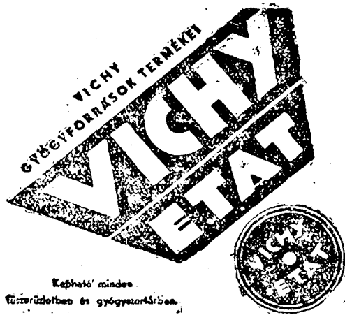
Kapható minden Tüzerüzletben és gyógyszerárúban.