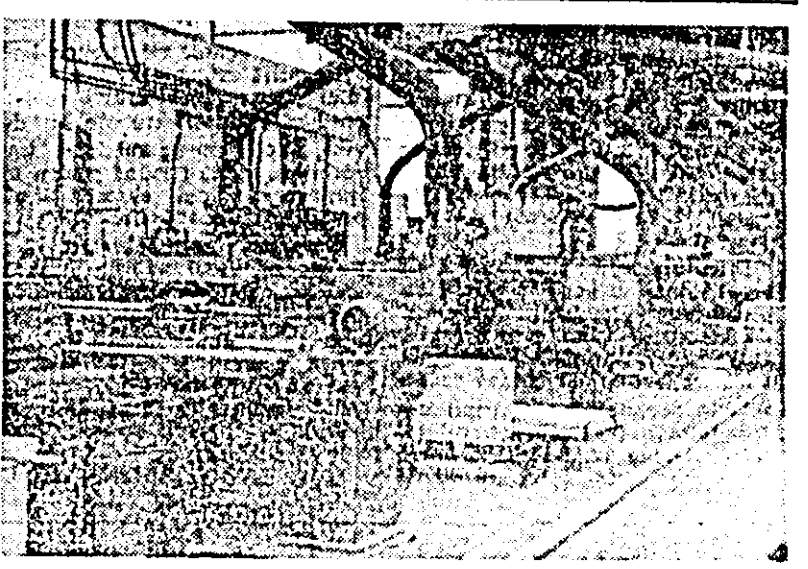
Aspect din atelierul I mobilă, sectorul șlefuit uscat al Combinatului de prelucrare a lemnului.

dar, prim-secretar al Comitetului Central al Partidului Muncitoresc Socialist Ungar, va avea loc, în zilele următoare, o întâlnire prietenească, în zona de frontieră, la Oradea și Debrecen.