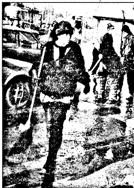
Doar cu o floare - citește măturat - nu se se face primăvară...