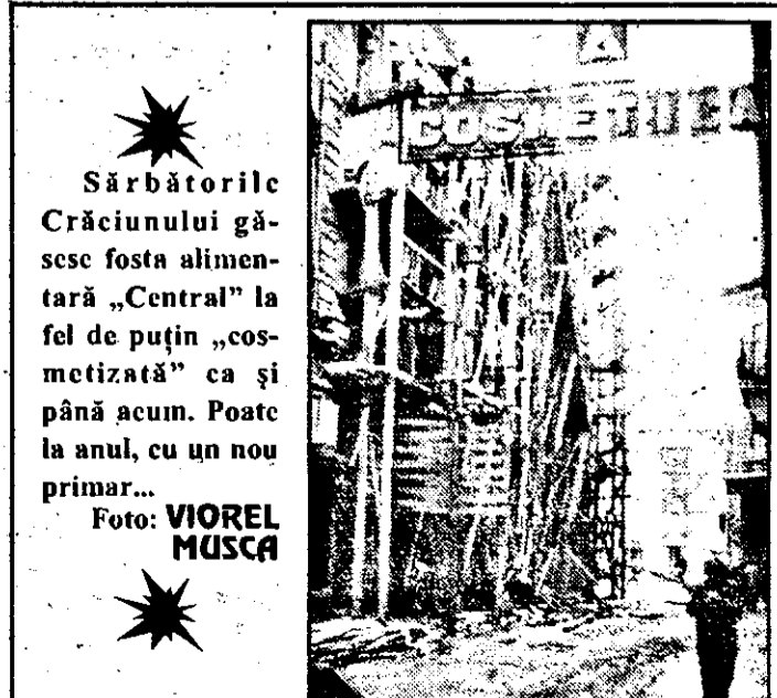
Sărbătorile Crăciunului găsește fosta alimentară „Central” la fel de puțin „cosmetizată” ca și până acum. Poate la anul, cu un nou primar...