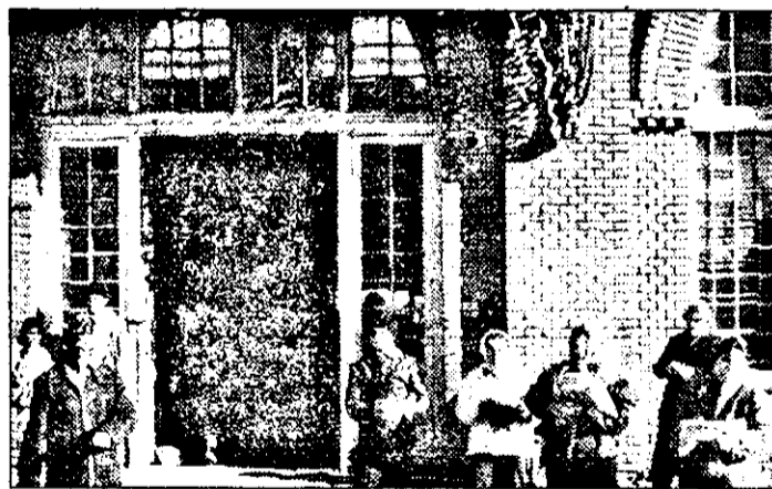
În fața Stației CFR Arad, doar vânzătoarele de semințe mai colorează atmosfera. Și la propriu și la figurat...