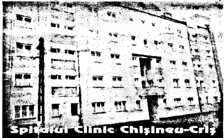
Spitalul Clinic Chișineu-Criș