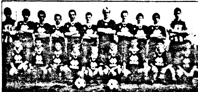
FC UTA '86 - campioană județeană