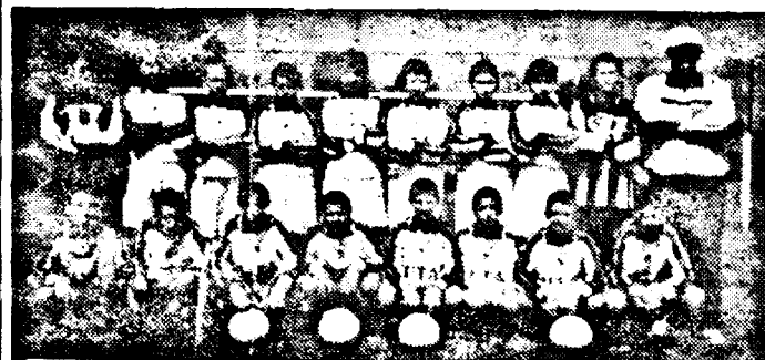
Grupa 1987, de la FC UTA, cea mai bună din Arad la această categorie de vârstă