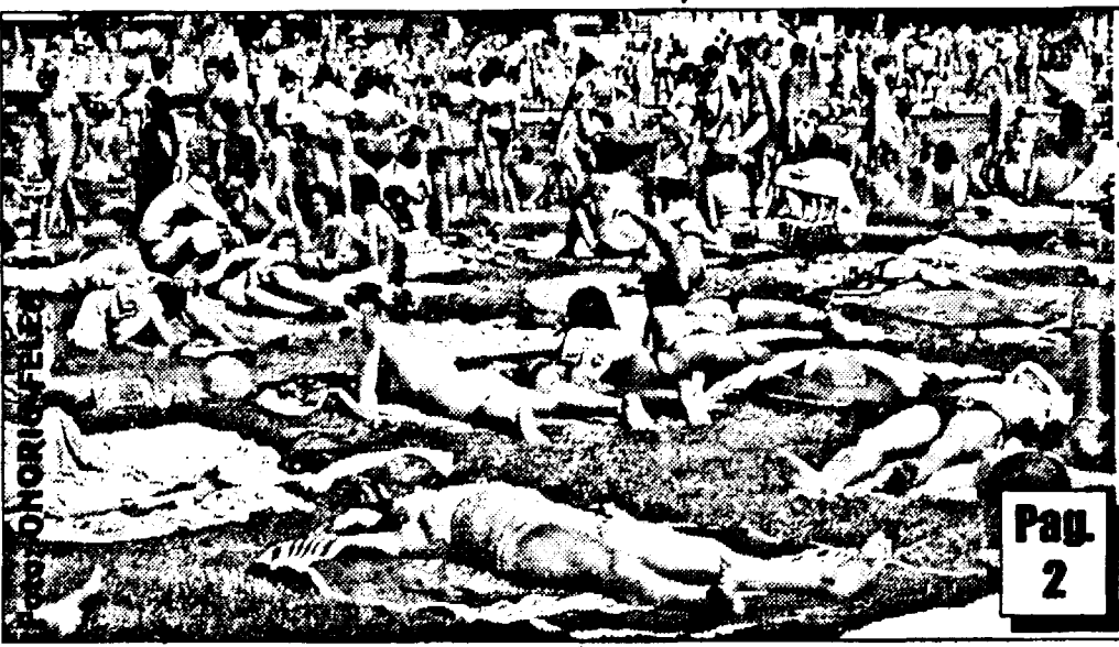
Afluența de arădeni pe strand poate fi una din cauzele interesului firmelor străine

▼ Arădenii care au făcut investiții la strand se tem de schimbarea patronului