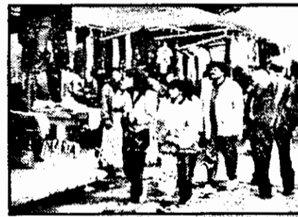
Mulți privesc - puțini deschid punga pentru a cumpăra.