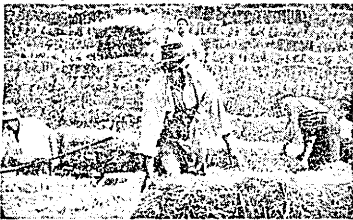
La C.A.P. Seleuș se acționează la eliberatul terenului și depozitarea baloților de pale.