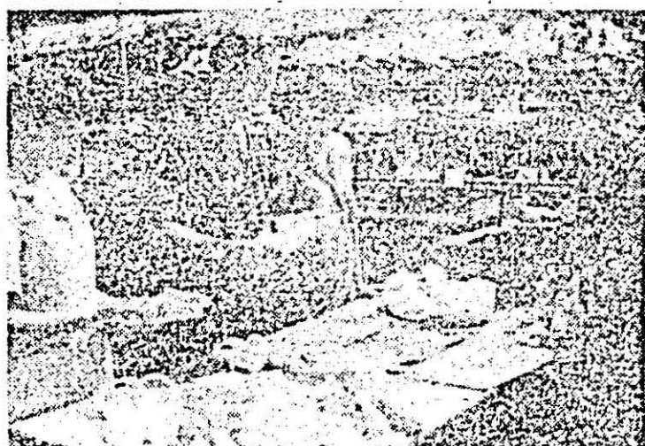
Întreprinderea „Libertatea”. La punctul de control C.T.C. se verifică cu atenție calitatea produselor.