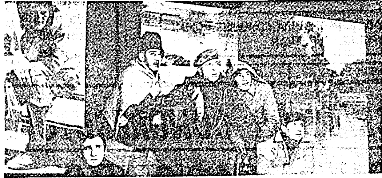
Scenă din spectacolul document „Diluvul”, prezentat zilele trecute în premieră pe scena teatrului arădean.

Într-o atmosferă de o autentică sărbătoare pionierescă, ieri după-amiază, pe scena Teatrului de stat a început faza republicană, zona Arad, a „Festivalului cultural-artistic al pionierilor și elevilor” închinat aniversării semicentenarului Partidului Comunist Român. Pe scenă au evoluat formațiile artistice pionieresti care reprezintă județele Bihor și Arad. Cele treisprezece puncte