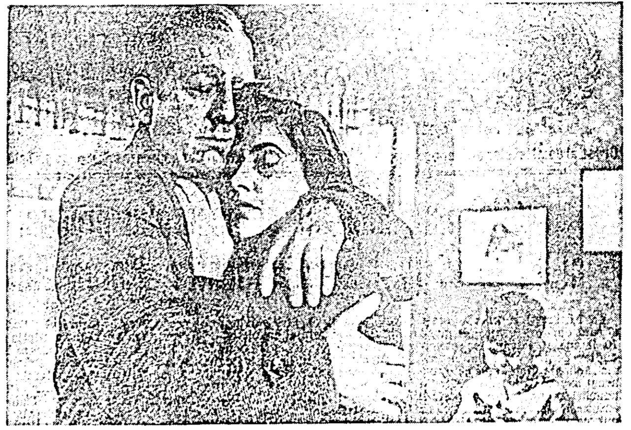
Pe ecranul cinematografului „N. Bălcescu” în clișeu: o secvență din film.

Publicul a aplaudat cu căldură concertul tinerilor artiști.