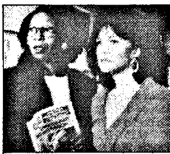
SAT1-21,15 Savoniera - comedie SUA, 1991

9,30 Magazin economic 10,30 Vaporul iubirii - rel. 11,30 Vecinii - s.Australia