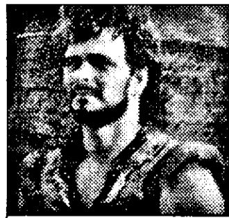
PRO 7-23,00 Steel Dawn-f. fant. SUA 1987

8,30 Hello, Austria - magazin 9,00 Știri ITN 9,15 Bursa 9,30 Ediție internă