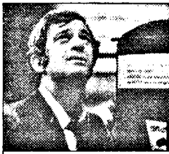
Budapesta 1-1,30 Profesionistul-f. act. FR 1981

20,30 Mod de viață 21,00 X Press Entertainment 23,00 Știri ITN