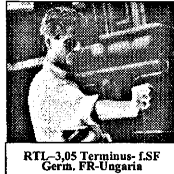
RTL-3,05 Terminus-f.SF Germ. FR-Ungaria

7,00 La prima oră -mag. matinal 9,00 Ora de muzică 10,00 Telemag Worldnet 10,30 Magazin CFI