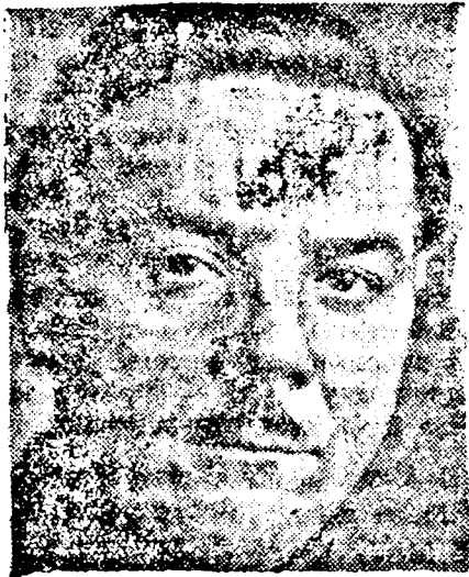
VOROSILOV hadügyi népbiztos

A budapesti orosz kolónia vezetője, egy görög keleti orosz pap kijelentette az újságíróknak, hogy a párisi hírral szemben ő még nem kapott semmiféle jelentést a kongresszusról. Magánértesülések szerint azért jelölték meg a kongresszus székhelyül Budapestet, mert a magyar főváros ugy a Balkánon, mint a nyugati országokban élő emigránsok számára a legkönnyebben megközelíthető lenne. Magyarországon különben jelenleg 4000 orosz él.