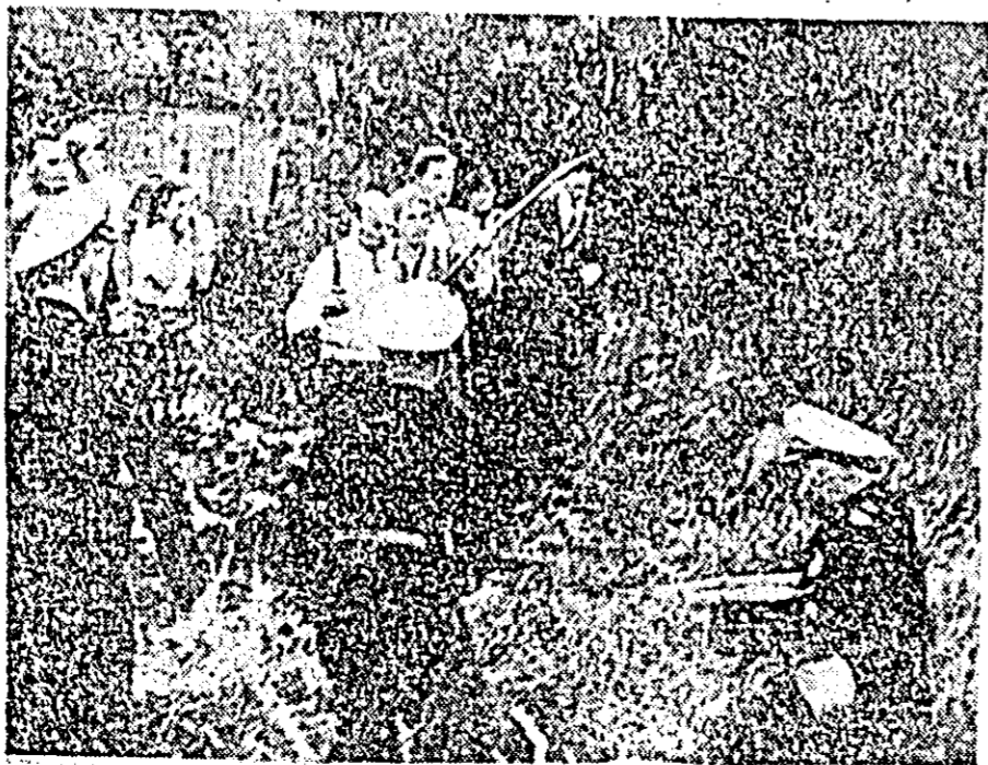
În clișeu: un aspect care ne înfățișează intervenția poliției vest-germane împotriva locuitorilor din Grossen Blink, înarmați cu bastoane de cauciuc, polițiștii au cerut locuitorilor să-și dărâme casele pentru a face loc construcțiilor militare americane.

pație americane. Cind poliția a intervenit în mod brutal împotriva femeilor care s-au ridicat pentru a-și apăra căminele lor, locuitorii s-au ridicat cu furcile. În ajutorul locuitorilor din Grossen Blink au venit și muncitorii de la șantierul naval din Bremerhaven.