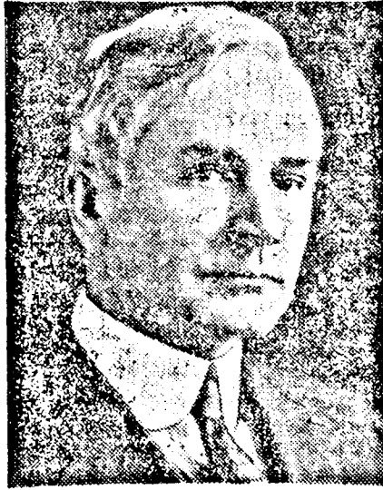
Cordell HULL amerikai külügyminiszter

Egyébként a világgazdasági konferencia delegátusainak tiszteletére Rothermere lord is