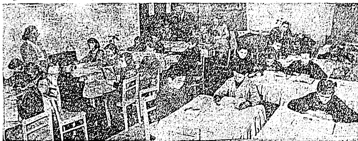
Aspect din căminul de zi pentru școlarii din Pirneava.