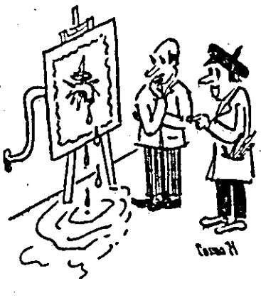
— Ultima mea lucrare, art-pop...